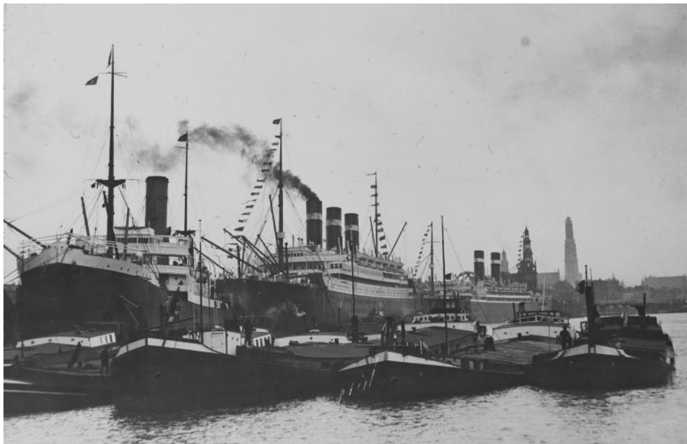
2 Schepen bij de Red Star Line in Antwerpen