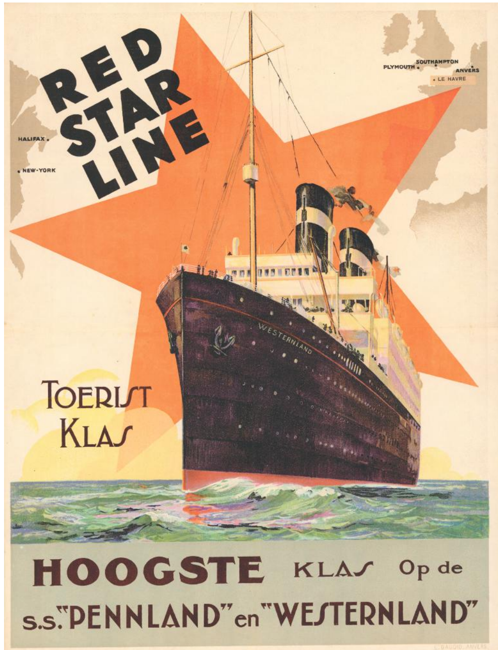
3 Affiche met het schip Westernland