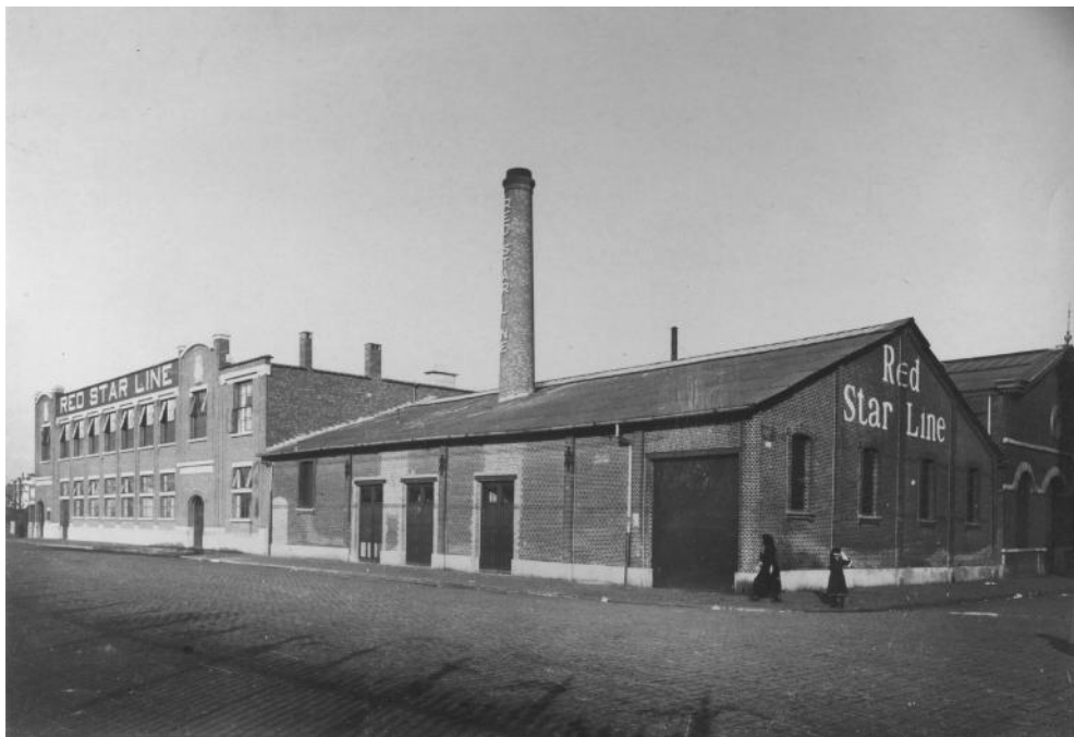
1 Gebouwen Red Star Line in Antwerpen

Auteur, leesbevorderaar, trainer Samen Lezen