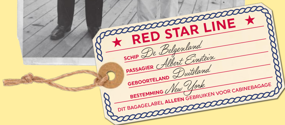
37 Einstein met commandant van de Belgenland in 1930